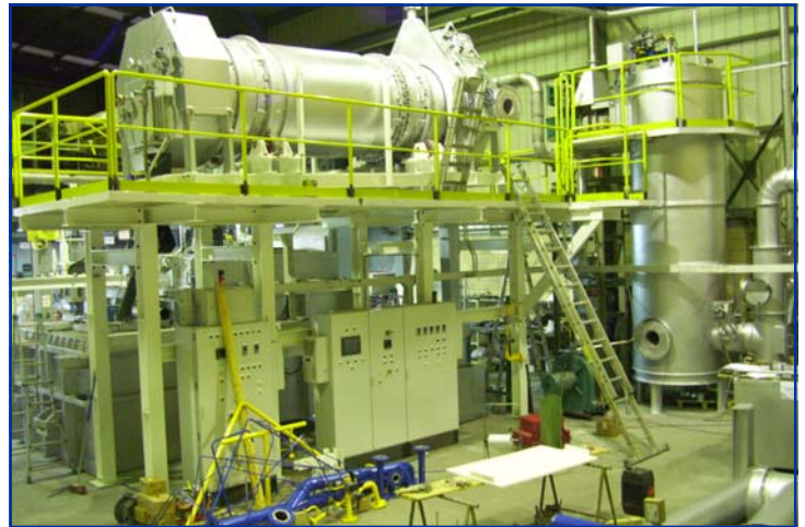
Instalación Secado Virutas 1000 kg/hr