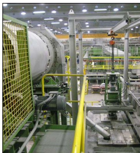
Carga de viruta al ALUSWIRLER