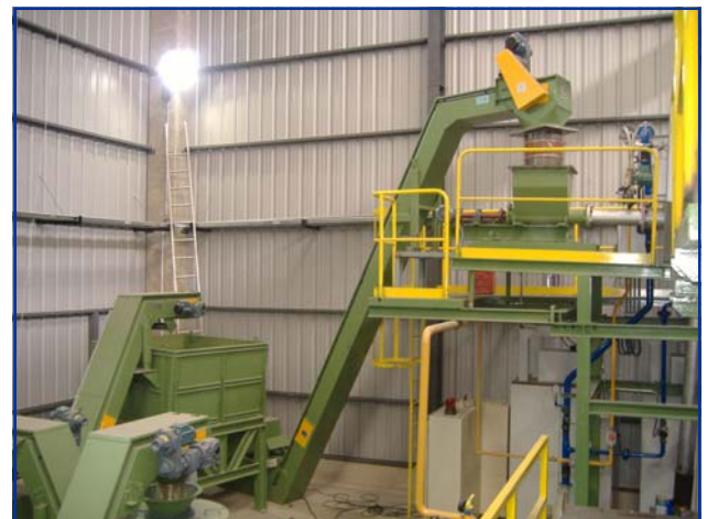
Separador magnético, Tolva y Secador Virutas