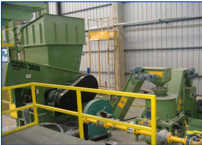
Triturador y Centrifuga de Virutas